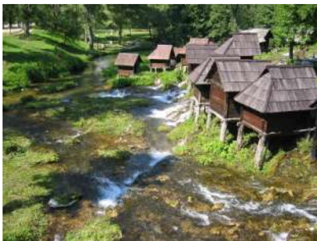
Jajce (Bosnia y Herzegovina)