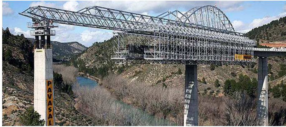
La mejora de las infraestructuras de transporte es clave para mejorar la competitividad de las empresas exportadoras valencianas.