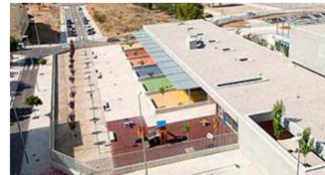
La Conselleria de Educación plantea la construcción de 124 nuevos centros. EE