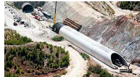
La infrananciación y la alta deuda lastran la capacidad de inversión de la Generalitat. EE