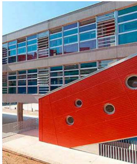
En las próximas semanas, la patronal Cierval presentará una 'hoja de ruta'. EE